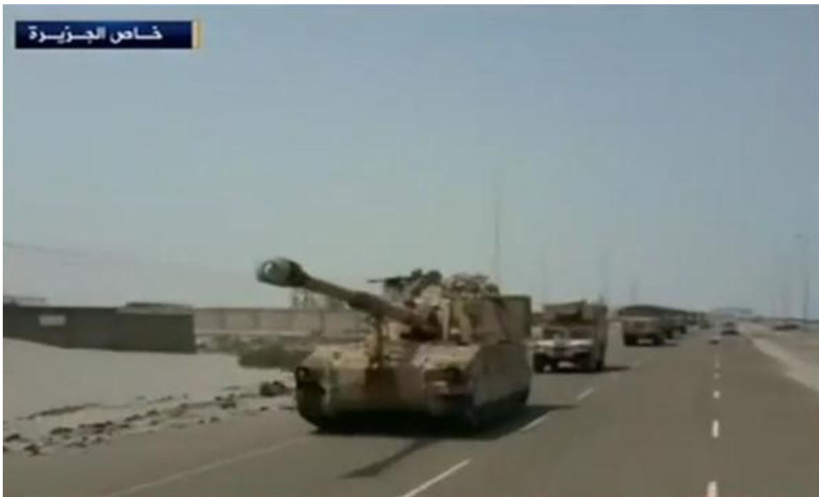
Op de foto: M109 Howitzers in Jemen.

In 2015 kreeg wapenbedrijf Thales nog een vergunning voor de miljoenenexport van radarapparatuur voor nieuwe schepen voor de Egyptische marine. De regering negeerde daarbij de deelname van deze marine aan de zeeblokkades in het kader van de Jemen-oorlog.