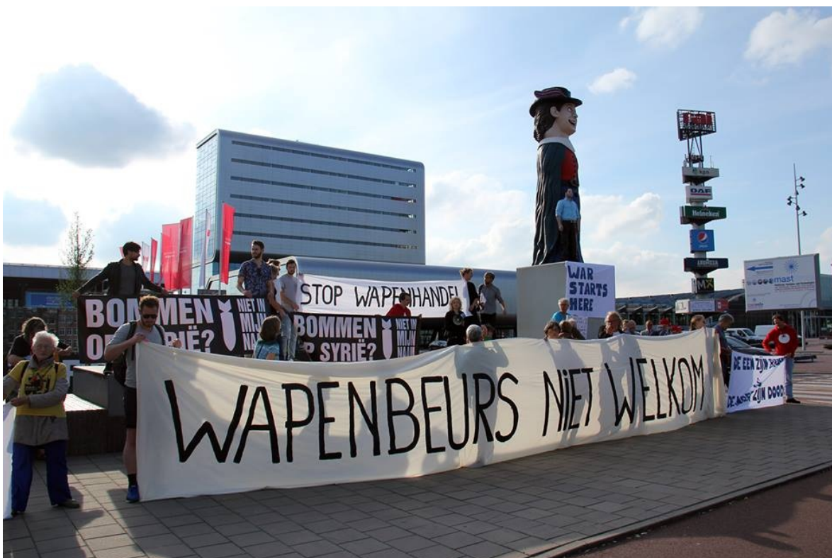
Op de foto: protest bij de ingang van wapenbeurs MAST.

In juni 2016 vond in Amsterdam de internationale maritieme wapenbeurs MAST plaats. Met expliciete steun van de Koninklijke Marine waren officiële delegaties uitgenodigd uit landen in conflictgebieden, landen met militaire regimes, en landen waar ernstige mensenrechtenschendingen plaatsvinden. Vooral het uitnodigen van Saoedi-Arabië was controversieel en stuitte op protesten. Uiteindelijk kwam dat land niet opdagen, en sprak de Amsterdamse gemeenteraad zich expliciet uit tegen wapenbeurzen in de stad.