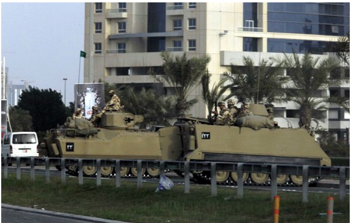
Op de foto: Pantservoertuigen op weg naar het Parelplein. Bahrein, februari 2011.

Niet alleen de wapenindustrie, ook het Nederlandse Ministerie van Defensie is een belangrijke wapenexporteur. Regelmatig worden door het leger afgedankte wapens verkocht naar het buitenland. Er is een grote tweedehands en zelfs een derdehands markt voor wapens. Eenmaal verkochte wapens kunnen nog decennialang opduiken. Deze eeuw waren bijvoorbeeld Chili, Peru en Jordanië grote afnemers van tweedehands wapens uit Nederland. Jordanië kreeg zelfs pantservoertuigen kado.