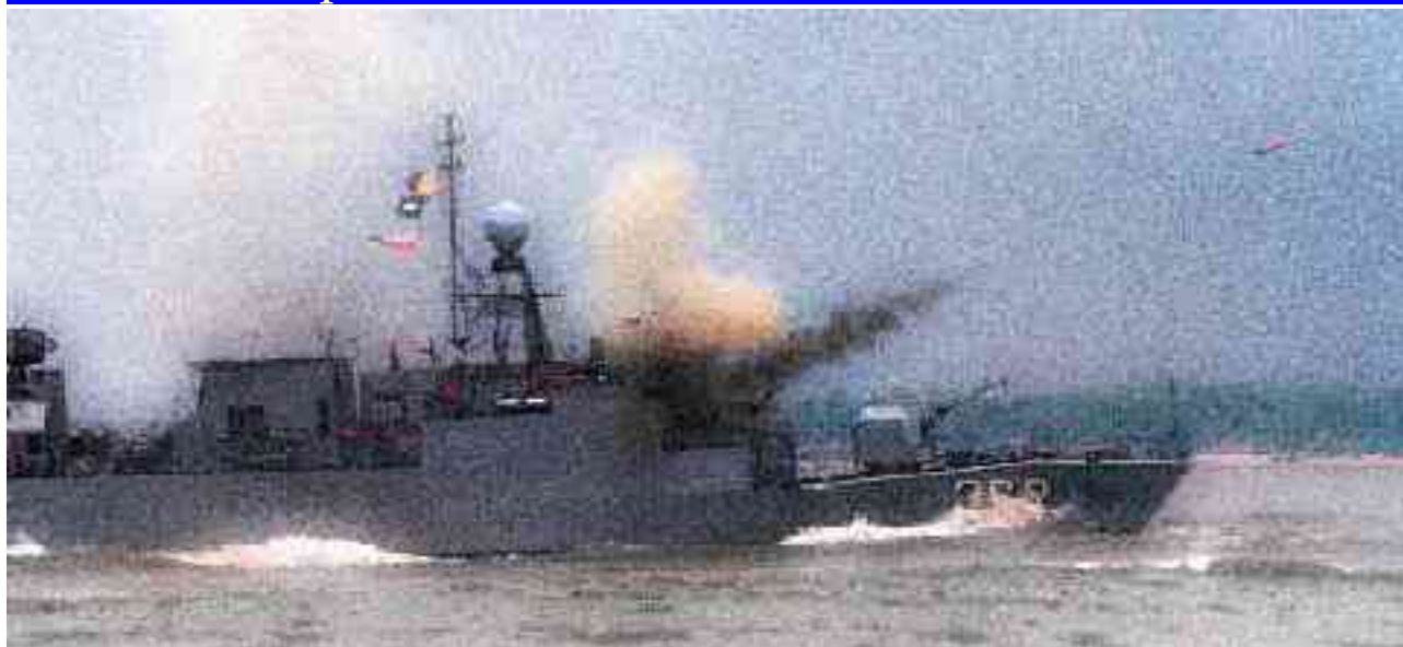
Eerder door Nederland geleverd korvet

Nederlandse wapenleveranties aan Indonesië zijn niet nieuw. 70 Sinds de jaren zeventig gaat een gestage stroom Nederlandse wapentechnologie richting Jakarta. De invasie van Oost-Timor, de miljoenen politieke gevangenen en alle andere grove schendingen van de mensenrechten hebben spelen nooit een grote rol bij het al dan niet leveren van wapens. De oppositie tegen een eerder korvettencontract - nota bene vlak na de invasie van Oost-Timor in 1975 - is niet in staat om de regering tot andere gedachten te brengen. 71