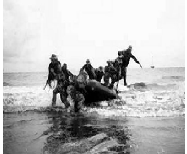
Aan de horizon vaart vermoedelijk de Hadjar Dewantara

Ook voorbeelden uit het verleden maken duidelijk dat de schepen mogelijk ingezet zullen worden voor troepentransporten. Wanneer Indonesië in de jaren tachtig de fregatten van de Van Speyk-klasse van Nederland overneemt, zegt de commandant van de Oostelijke vloot, dat die fregatten prima geschikt zijn voor transporttaken. 45 Dat is nu eenmaal belangrijker in een archipel met 17.000 eilanden en een leger dat zich vooral richt op binnenlandse onderdrukking, dan de onderzeebootbestrijding en luchtverdedigingstaken waarvoor ze eigenlijk bedoeld zijn. 46