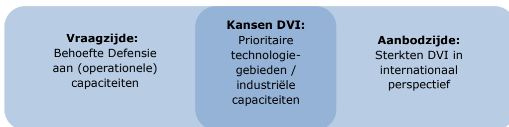
Figuur 3: Match van vraag- en aanbodzijde, leidend tot prioritaire technologiegebieden / industriële capaciteiten 10 .

Deze deelverzameling is kansrijk om de hierop actieve DVI te positioneren, in overeenstemming met de doelstelling van de DIS.